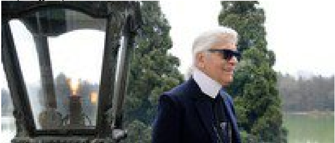
A Parigi all'asta l'appartamento 'futurista' di Karl Lagerfeld