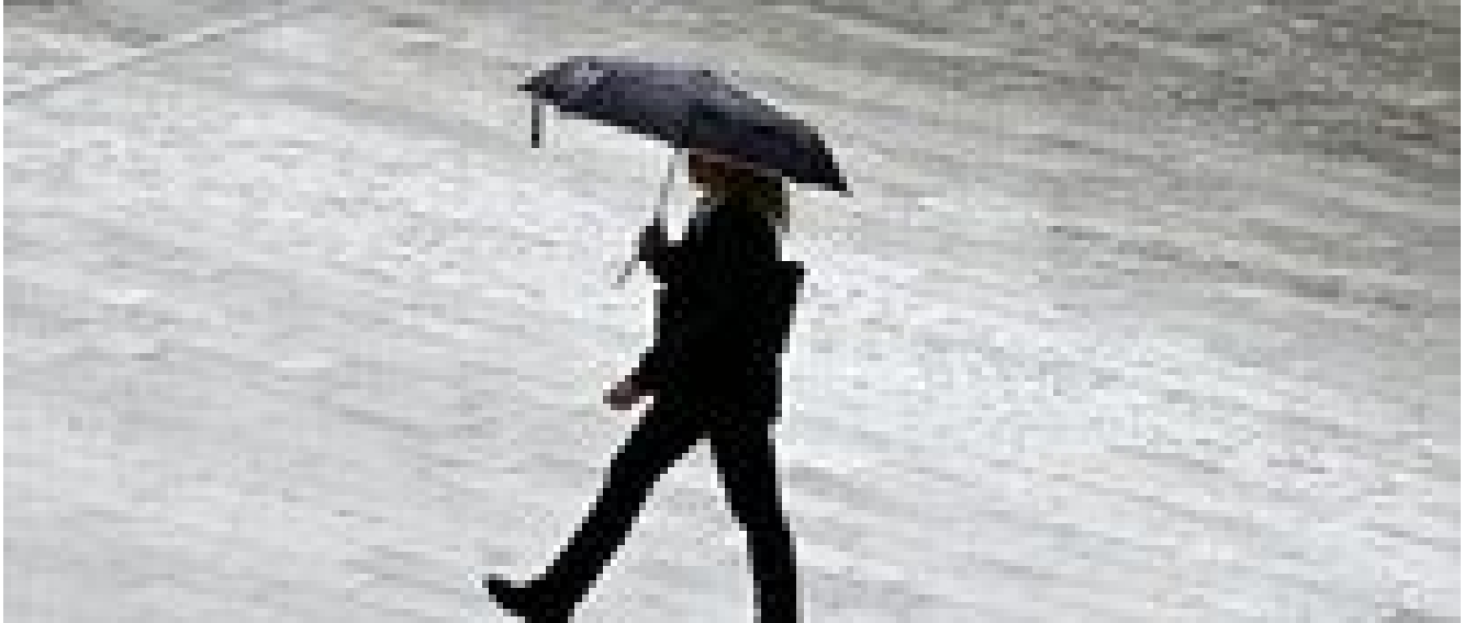
Ancora pioggia e neve in settimana, maltempo anche nel weekend