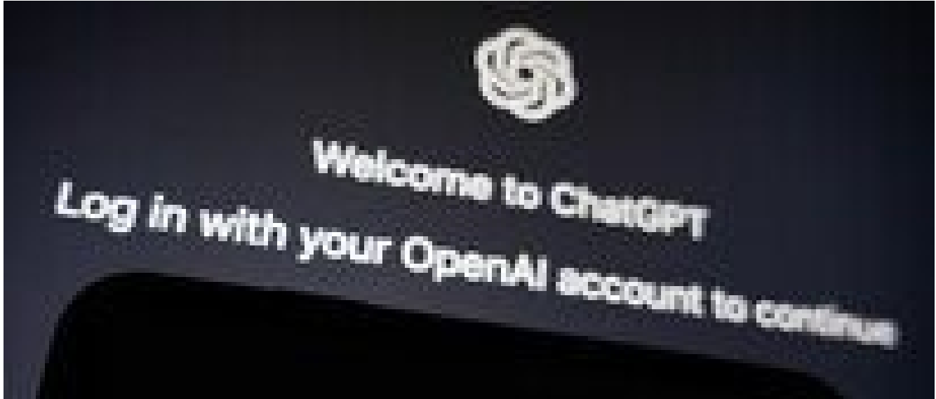
ChatGpt ora legge le risposte ad alta voce