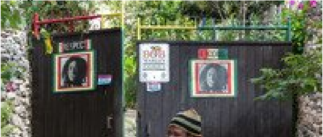
Revival Bob Marley, sono trend le tropical vibes della leggenda del reggae

Temi caldi Mar Rossol nchiesta Perugia Super Tuesday Mattarella Modello 730 / SALUTE&BENESSERE / Valori Condivisi